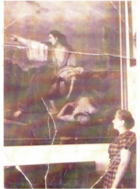
Εκδρομή στο Μεσολόγγι.

Ήταν μια εκδρομή που συνδύασε την ιστορία και την ψυχαγωγία. Σήμερα, εξήντα και πλέον χρόνια από εκείνη την εκδρομή και διακόσια από την Ηρωική Έξοδο των Ελεύθερων Πολιορκημένων η συγκίνηση παραμένει!