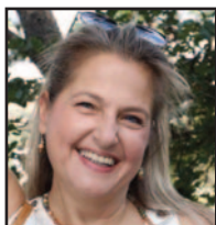
Γράφει η κ. Φένια Μιχαηλίδη