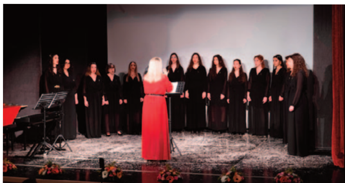
ΗΜΕΡΑ ΤΗΣ ΓΥΝΑΙΚΑΣ, ΟΙΝΟΠΟΙΕΙΟ ΠΕΤΡΟΥ