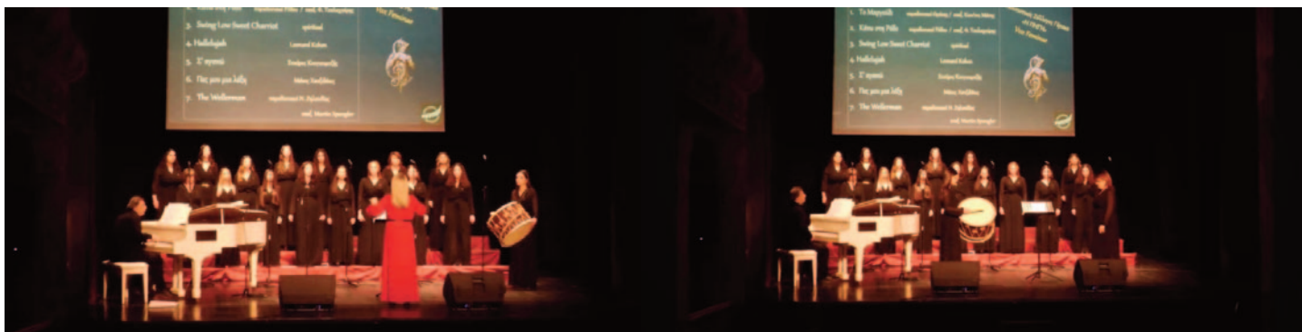
7ο Πανελλήνιο Χορωδιακό Φεστιβάλ του Πανός – Τρίπολη 2026