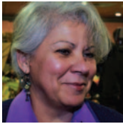
Γράφει η κ. Δέσποινα Βακάλη-Δαλιάνη