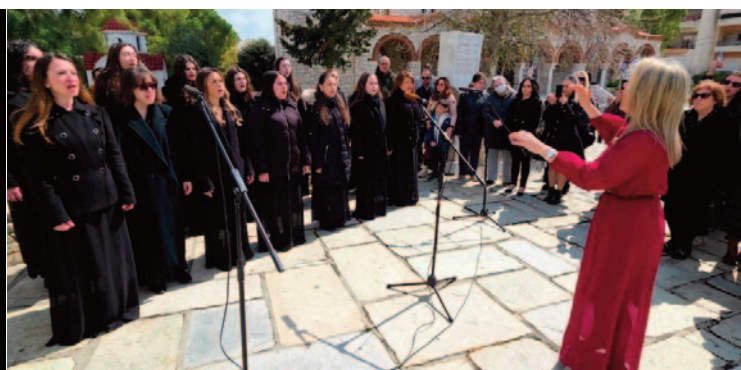
25η ΜΑΡΤΙΟΥ, ΑΓ. ΤΡΥΦΩΝΑΣ, ΠΑΛΛΗΝΗ